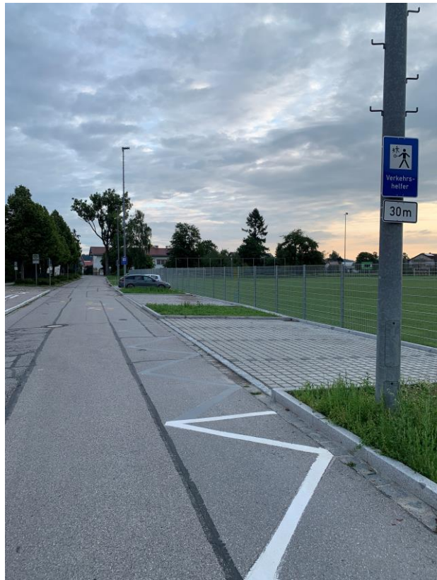
Zwei wichtige Tiefbauprojekte, die abgeschlossen sind: links die Aufwertung der Stadtplatzmittellinsel, oben die neuen Parkplätze in Mößling.