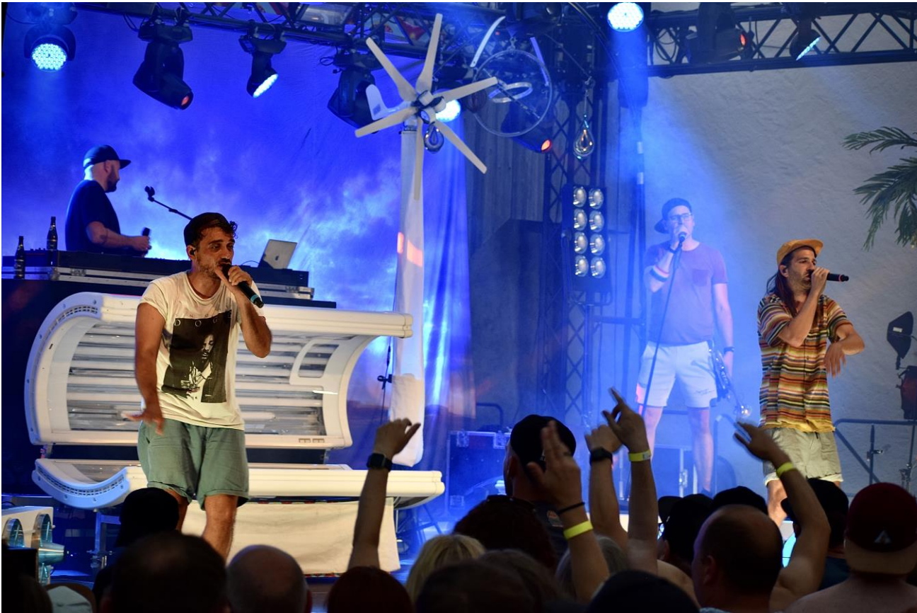
Dicht & Ergreifend begeisterten zum Auftakt des Sommerfestivals 2023 ihre Fans.