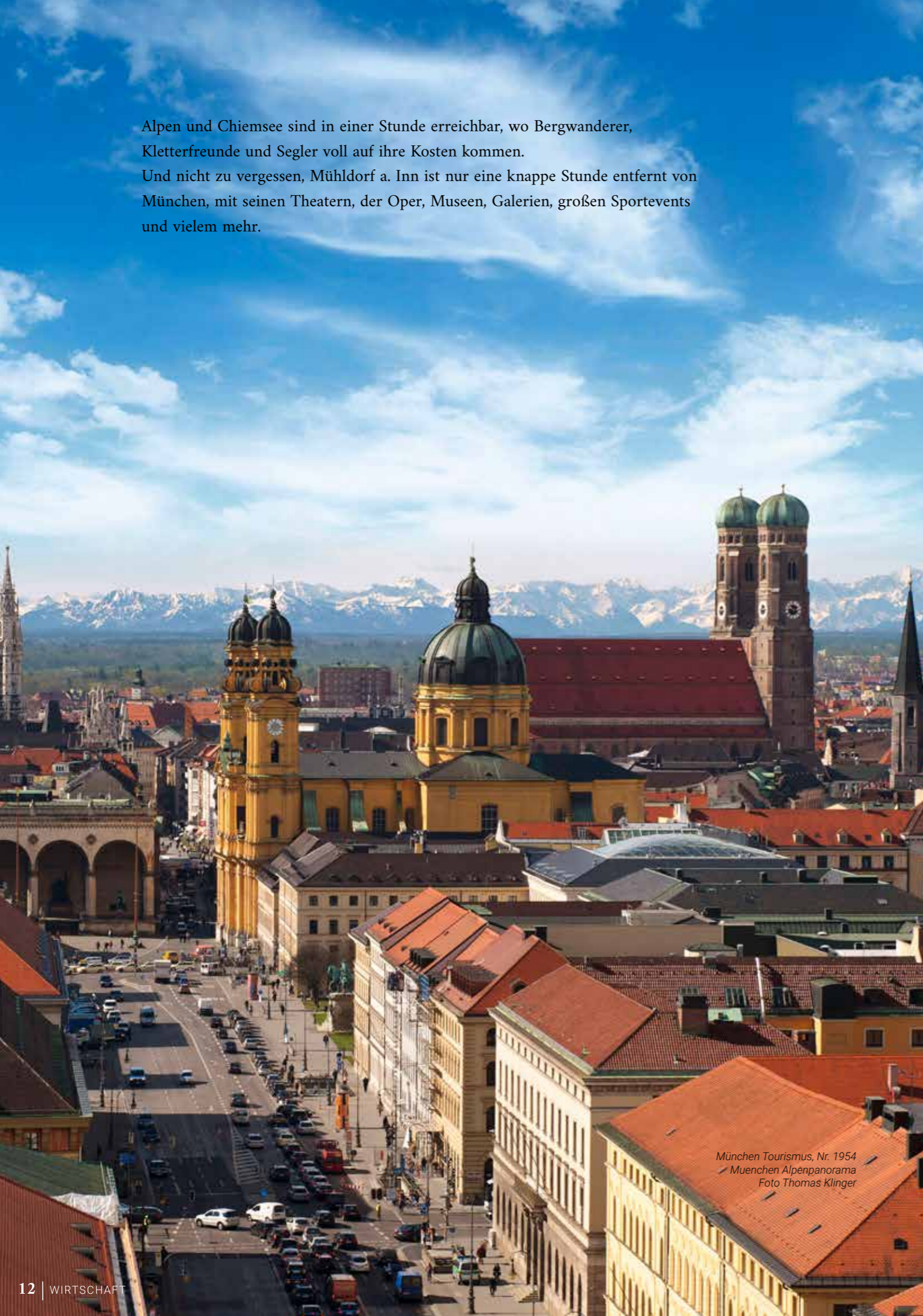
München Tourismus, Nr. 1954 München Alpenpanorama

Mühldorf a. Inn ist zentraler Ausgangspunkt für Radwanderwege in alle Richtungen. Besonders beliebt und empfehlenswert ist der Innradweg in Richtung Rosenheim und Innsbruck bzw. Passau und Wien.