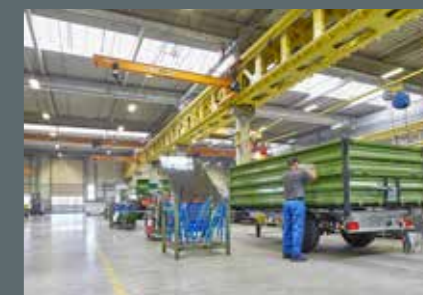
Fertigung bei Fliegl Agrartechnik GmbH