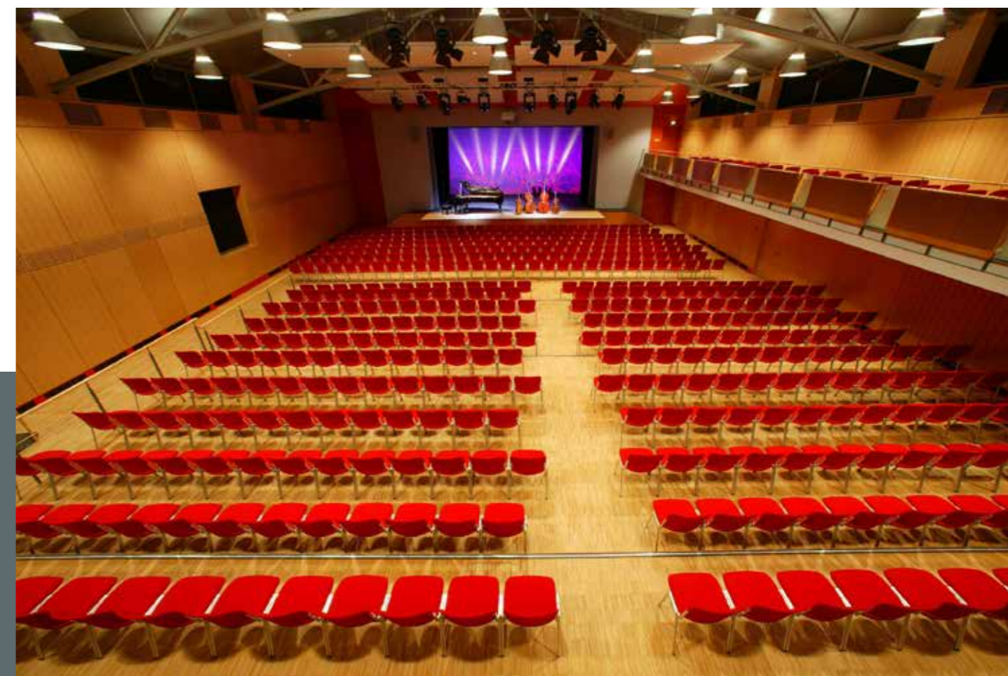
Der multifunktionale Stadtsaal in Mühldorf a. Inn bietet viele Möglichkeiten.