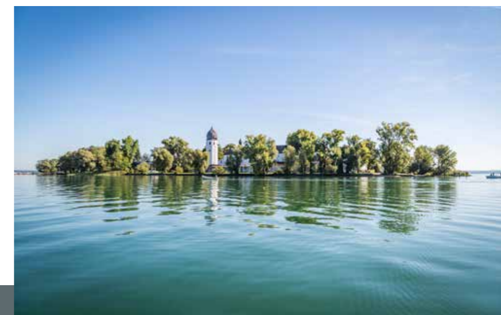
Malerischer Blick auf die Fraueninsel im Chiemsee