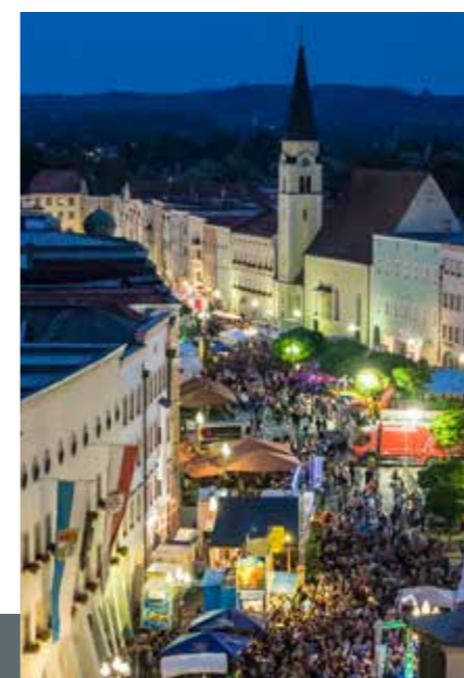
Feierlaune beim Mühldorfer Altstadtfest