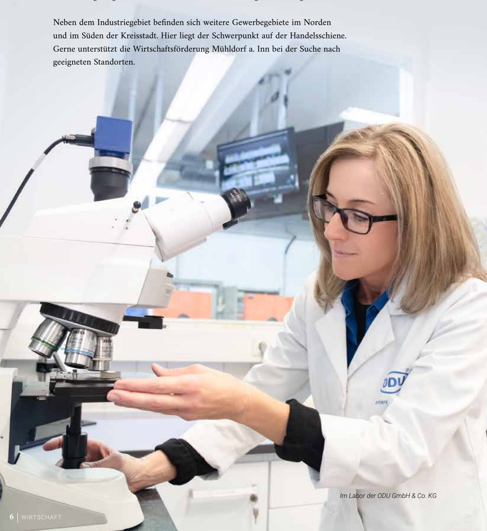
Im Labor der ODU GmbH & Co. KG

Neben dem Industriegebiet befinden sich weitere Gewerbegebiete im Norden und im Süden der Kreisstadt. Hier liegt der Schwerpunkt auf der Handelsschiene. Gerne unterstützt die Wirtschaftsförderung Mühldorf a. Inn bei der Suche nach geeigneten Standorten.