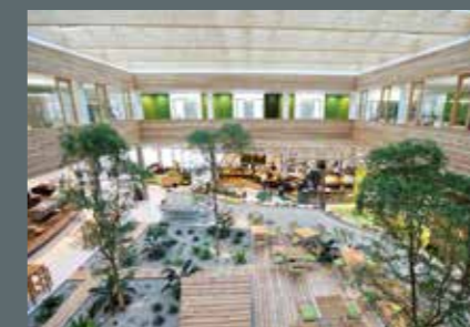
Genussküche Feinsinn bei Byodo Naturkost GmbH