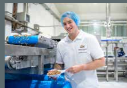
Qualitätssicherung bei Barnhouse Naturprodukte GmbH