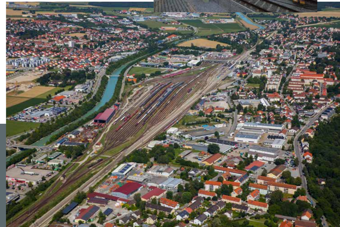
Der Bahnhof in Mühldorf a. Inn - ein wichtiger Eisenbahnknotenpunkt für Pendler und Güter