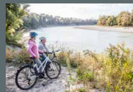
Beliebter Radstop mit Blick auf die Mühldorfer Innschleife