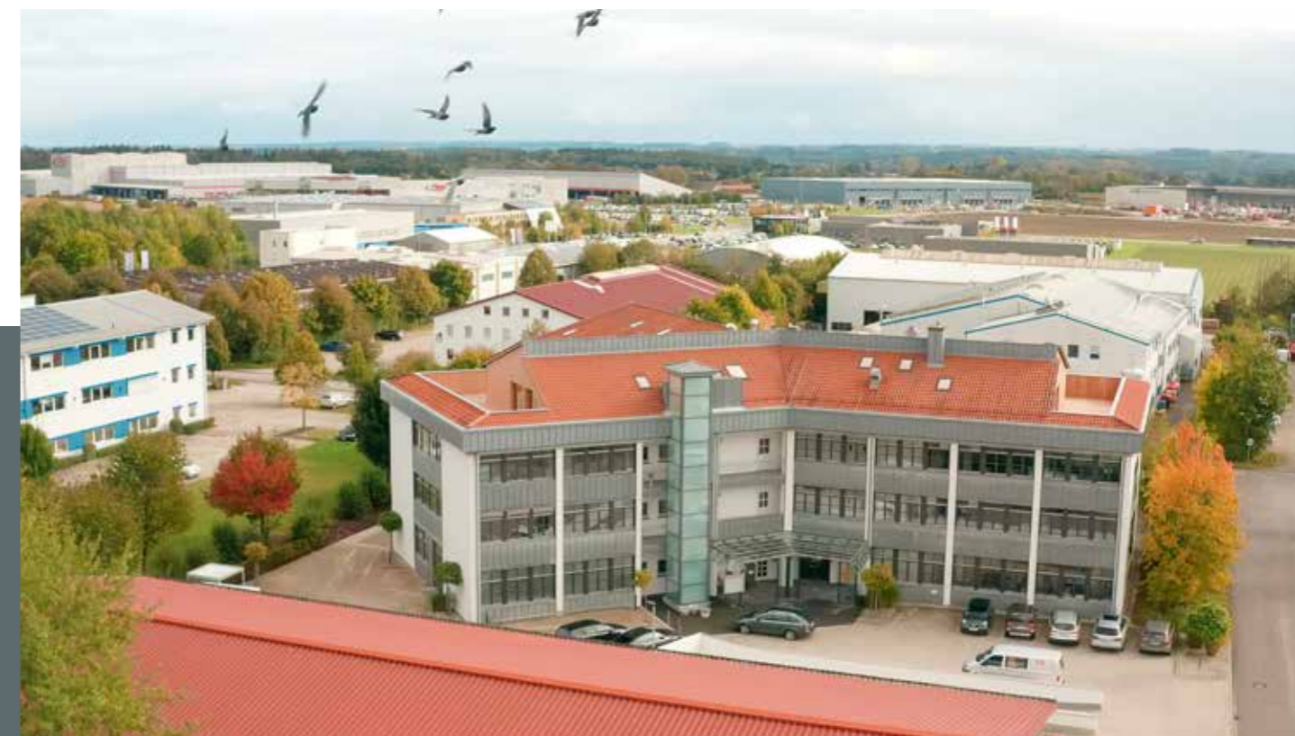
Campus Mühldorf am Inn der Technischen Hochschule Rosenheim