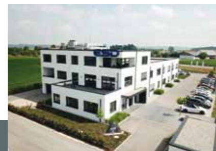
Bürogebäude der ESD Dienstleistungsgruppe