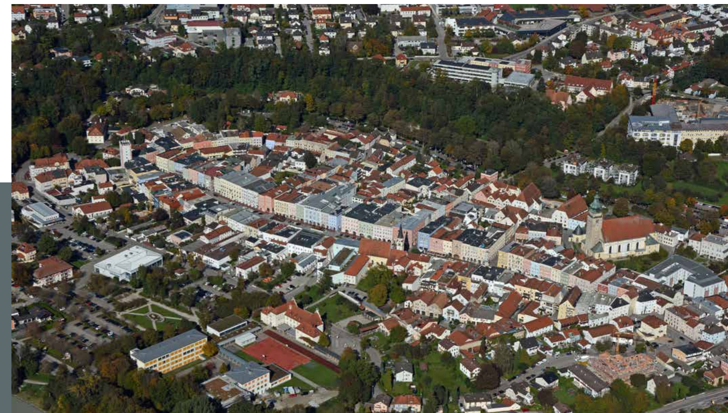
Die historische Mühldorfer Altstadt lädt Besucher zum Shoppen und Flanieren ein.