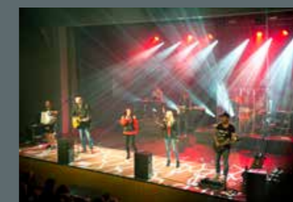
Kultur pur im Haberkasten und Stadtsaal