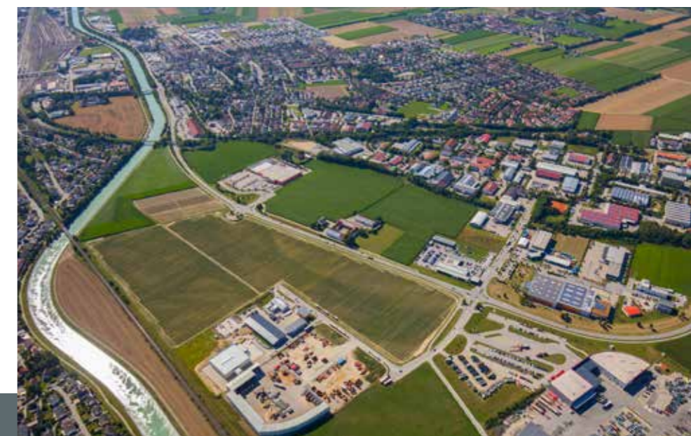
Industriepark in Mühldorf a. Inn - idealer Standort für viele erfolgreiche Unternehmen

Zudem ist Mühldorf a. Inn Zentrum der Naturkosthersteller wie Byodo Naturkost GmbH, Barnhouse Naturprodukte GmbH, Ceralia GmbH und PrimaVera Naturkorn GmbH.