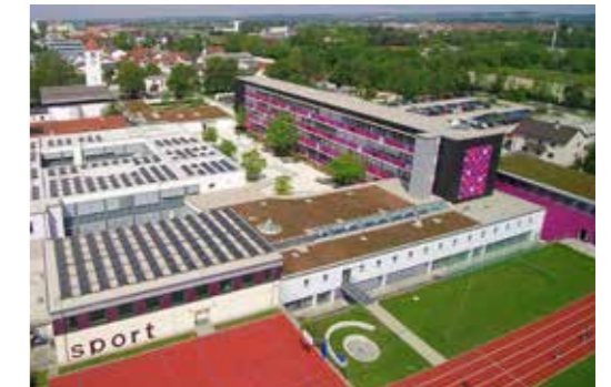
Ruperti-Gymnasium Mühldorf am Inn