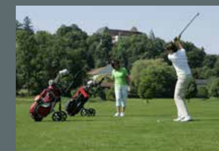
Golfen auf Schloss Guttenburg